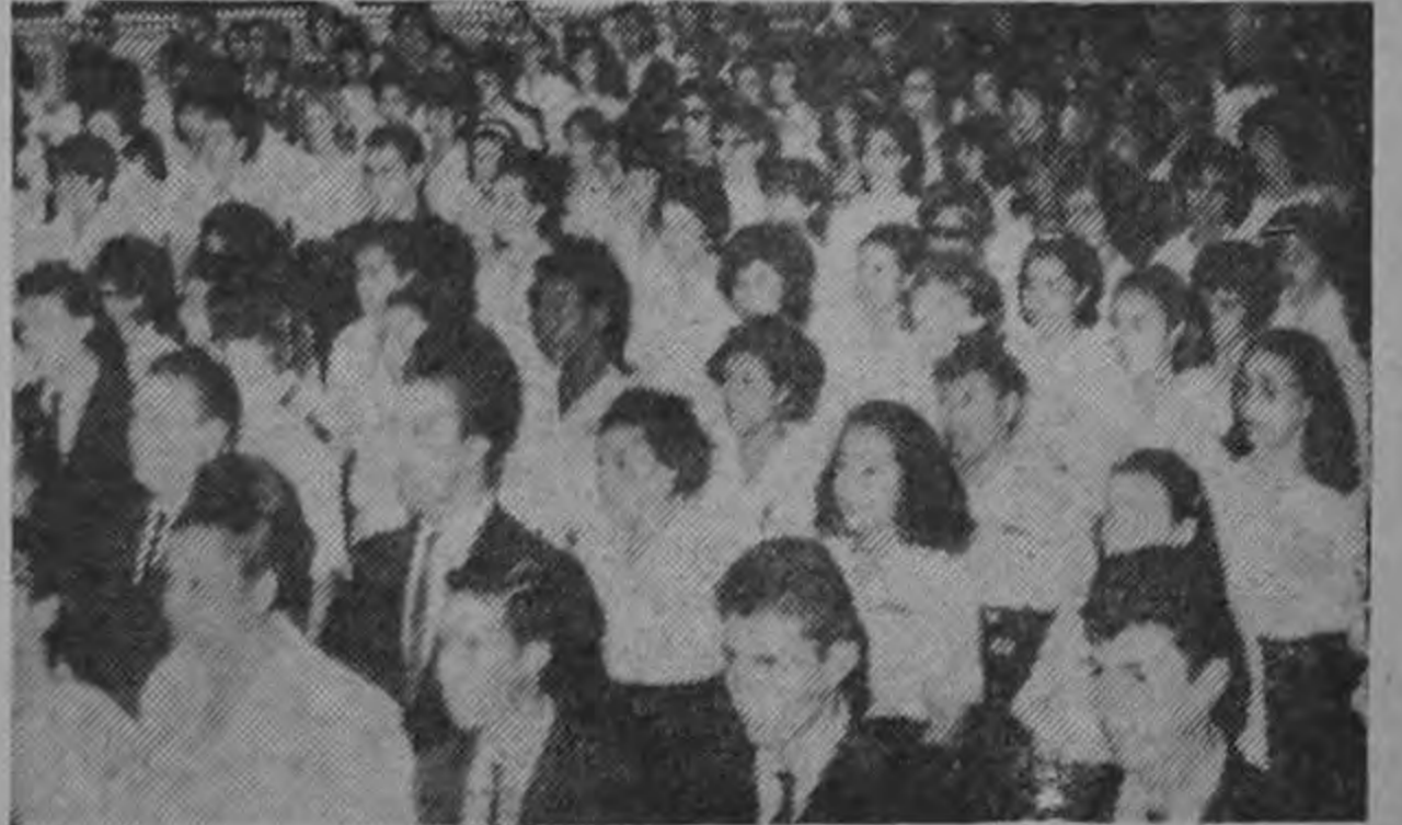
LA CONCURRENCIA AL ACTO DE LA UNESCO.— La platea del Teatro Nacional llena de universitarios en la inauguración de la reunión de Expertos Sobre Enseñanza Superior y Desarrollo de la América Latina, patrocinada por la UNESCO que tuvo lugar ayer por la mañana.

Al daros la bienvenida, en nombre del señor Presidente de la República y en el mío propio, y al ofrecerles la generosa hospitalidad de nuestro pueblo, deseamos que el espíritu del Supremo Hacedor ilumine nuestras mentes para que de vuestra reunión América Latina coseche grandes y certeras soluciones a sus grandes problemas de desarrollo.