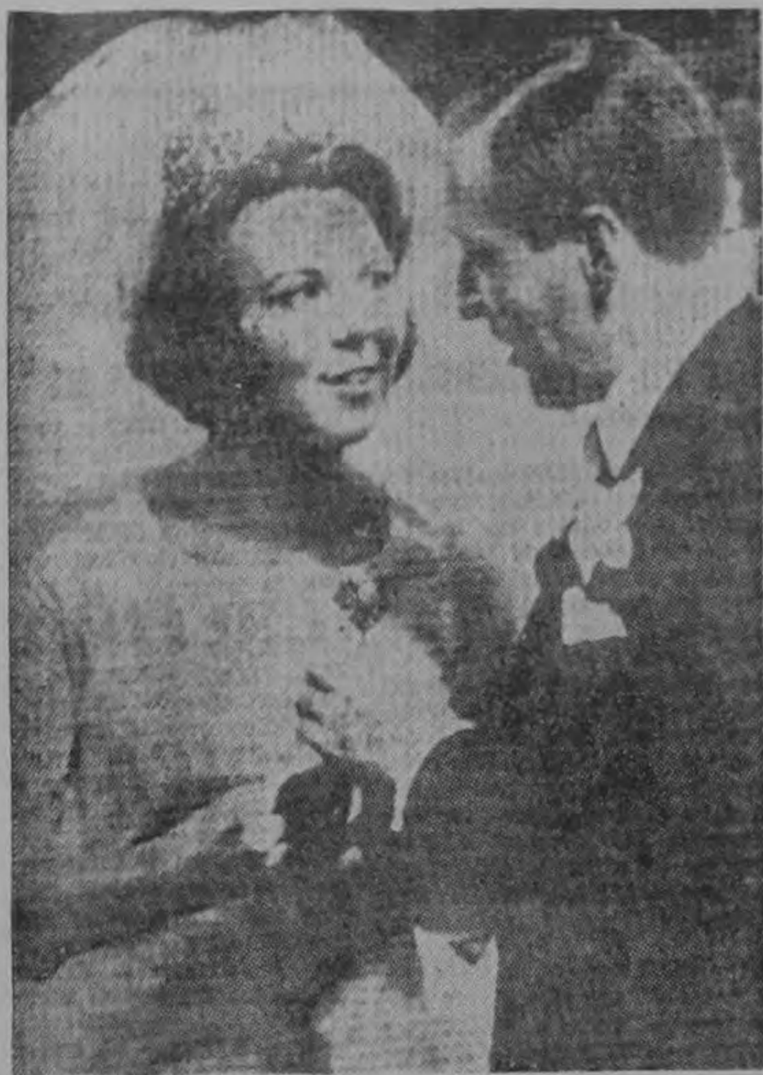
La Princesa Beatriz, futura reina de Holanda, y Claus Von Amsberg, Duque de Van Amsberg, su esposo, conversan pocos minutos después de la ceremonia.

La heredera de la Corona, Beatriz, de 28 años, futura Reina de Holanda contrajo matrimonio en una ceremonia de extraordinaria suntuosidad, con el diplomático alemán Von Amsberg, en una ceremonia en la que figuraban 20 Reyes, Príncipes y Princesas.